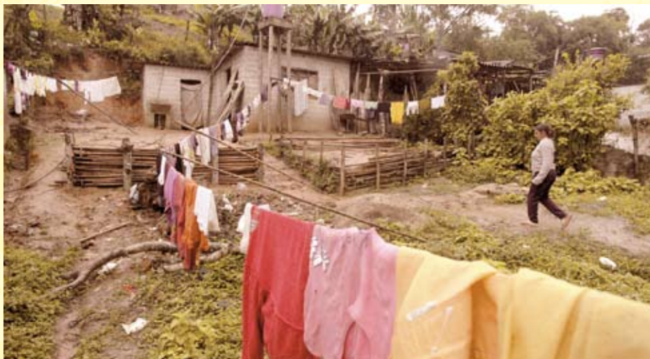
Die Region Parelheiros ist stark von Armut geprägt. ProBrasil möchte den hier lebenden Menschen ermöglichen, ein Einkommen zu erwirtschaften und sie auf das Berufs- und Arbeitsleben vorbereiten.

Die Situation der Frauen ist am schwierigsten in den Randgebieten der großen brasilianischen Städte. Hier findet sich die stärkste Konzentration von kinderreichen jungen Familien, allein erziehenden Müttern und Menschen dunklerer Hautfarbe. In einem solchem Stadtrandgebiet, ganz im Süden der Metropole São Paulo, ist der Verein ProBrasil seit 1999 tätig. Die Region heißt Parelheiros und ist in besonderer Weise von Armut und Ausgrenzung gekennzeichnet. Mehr als zwei Drittel der indigenen Bevölkerung der Metropole leben hier. Parelheiros ist einer der 31 Verwaltungsbezirke von São Paulo und nimmt dabei ein Viertel des weit ausgedehnten Stadtgebietes ein: 360 km 2 , die überwiegend von atlantischen Regenwäldern bedeckt sind. Die wenigen deutschen und japanischen Siedler, die Anfang des vergangenen Jahrhunderts hier Landwirtschaft betrieben, wurden vor rund 20 Jahren mit einer massiven Binnenmigration aus dem armen nordöstlichen und nördlichen Brasilien konfrontiert. Inzwischen leben hier in dem vom Zentrum weit abgelegenen Gebiet rund 300.000 Menschen. Die berufstätige